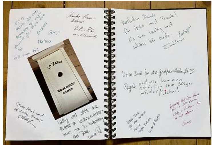
Auch die Gäste fühlen sich im Rechenmacherhaus und bei den Gastgebern wohl, wie die Gästebucheinträge zeigen.